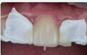
7. Valokoveta silikoni-indeksin läpi ja poista se sitten paikoiltaan