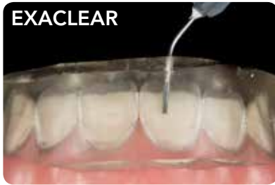
Muovin injektioimista voi seurata visuaalisesti.

EXACLEAR on innovatiivinen, kirkas silikonimateriaali, joka täyttää vaativien esteettisten töiden asettamat vaatimukset ja auttaa saavuttamaan upean lopputuloksen. Materiaalin täydellinen läpinäkyvyys tekee siitä erityisen tehokkaan vaihtoehdon hankaliin kliinisiin tilanteisiin.