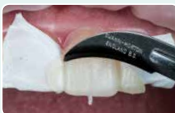
8. Poista muovin ylimäärät terällä