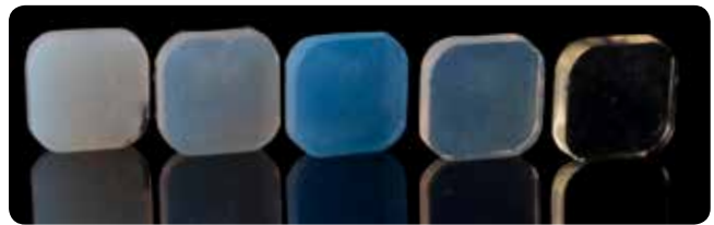
EXACLEAR-materiaalin läpinäkyvyys (äärimmäisenä oikealla) kilpailijoihin verrattuna.

Tämä lisää konversiota ja estää happi-inhibitiokerroksen syntymisen, mikä tekee viimeisestä kiillotusvaiheesta helpomman .