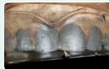
3. Poista kirkas silikoni lusikasta kovettumisen jälkeen