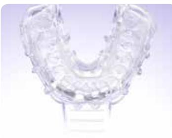
2. Täytä jäljennöslusikka EXACLEAR-materiaalilla ja ota mallin vahauksesta jäljennös