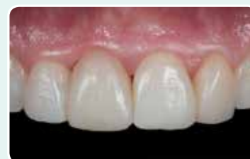
9. Lopputulos parin kiillotusvaiheen jälkeen