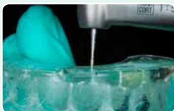
4. Poraa reikä silikoni-indeksiin muovin injektioimista varten