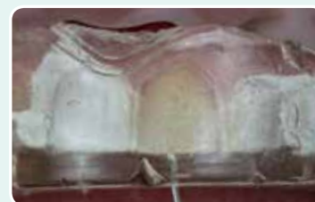
6. Aseta silikoni-indeksi suuhun ja injektoi G-ænial Universal Injectable indeksiin poratusta reiästä