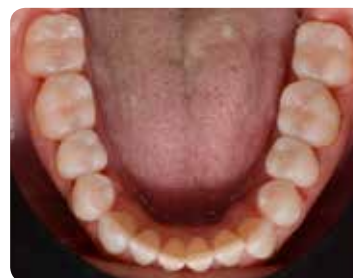
3. Tilanne injektiovalumenetelmän jälkeen