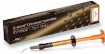
G-aenial Universal Injectable Erikoisluja injektoitava yhdistelmämuovi