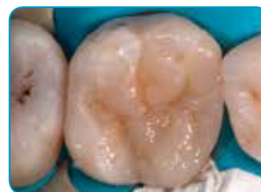
Viimeinen kerros Essentia-materiaalilla (Väri: Universal)