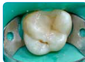
Viimeinen kerros G-aenial Universal Injectable -materiaalilla (Väri: A3)