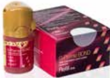
G-Premio BOND Universaali sidosaine