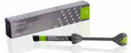
Essentia Universal Universaali pastamainen yhdistelmämuovi

everX Flow, Essentia, G-Premio BOND ja G-aenial Universal Injectable ovat GC:n tavaramerkkejä. Filtek Bulk Fill Flowable, SDR flow+ ja Tetric EvoFlow Bulk Fill eivät ole GC:n tavaramerkkejä.