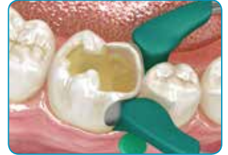
Jos kyseessä on luokan II kaviteetti, rakenna puuttuvat seinämät tavallisella yhdistelmämuovilla