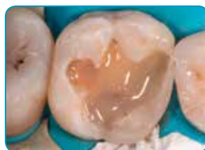
everX Flow -materiaalin applikointi (Väri: Dentin)