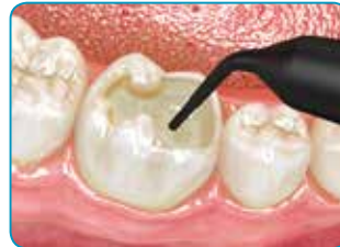
Täytä kaviteetti everX Flow -materiaalilla