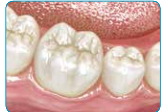
Lopputuloksena, kun työ on päällystetty tavallisella yhdistelmämuovilla